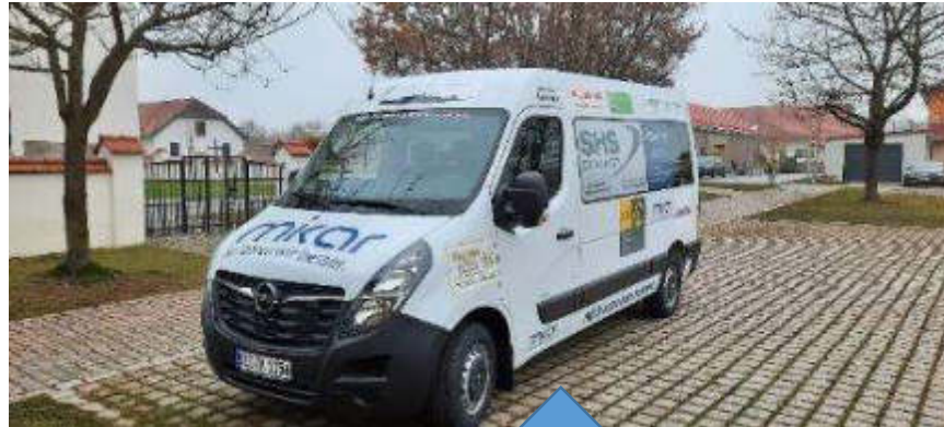
↑ Bürgerbus Kreative Dorfwerkstatt